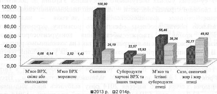
Рис. 3. Динаміка імпорту м'ясопродуктів, тис. т

Найбільше імпортувалося сало, свинячого та пташиного жиру (49,92 тис. т, або 35,8% від загального імпорту м'яса та м'ясопродукції у перерахунку на м'ясо), м'яса і харчових м'ясопродуктів птиці (38,36 тис. т), свинини (26,19 тис. т), субпродуктів харчових великої рогатої худоби та інших тварин (15,93 тис. т), а також консервованих м'ясопродуктів (2,58 тис. т), яловичини морозеної (1,42 тис. т, або 1%), ковбасних виробів (0,54 тис. т) та яловичини свіжої чи охолодженої (0,14 тис. т). Імпорт м'яса та м'ясопродуктів у перерахунку на м'ясо у січні – вересні 2014 року становив 138,9 тис. т, що менше проти аналогічного періоду 2013 року у 1,8 рази. Обсяги реалізації товаровиробниками в 2014 році м'ясної та молочної сировини власного виробництва за всіма напрямками і надходження необхідної її кількості по імпорту дали можливість забезпечити платоспроможний ринок м'ясо-молочної продукції для населення України і мати відповідний експортний потенціал [3].