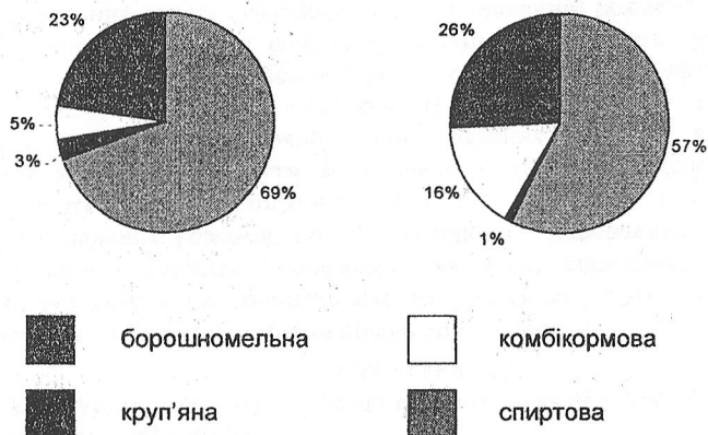
Рис. 1. Структура промислового використання зерна у Вінницькій області за 2004 і 2006 роки

Частка підприємств системи хлібопродуктів, що орендує землю у її власників і займається виробництвом сільськогосподарської продукції, перевела власні переробні потужності на баланс орендованих господарств, таким чином уникаючи податків та зменшуючи собівартість продукції.