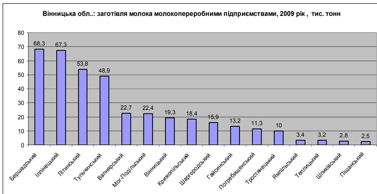
Рис. 1. Показники заготівлі молока по Вінницькій області у 2009 році.

Найбільшими виробниками молочної продукції у Вінницькій області є молочна компанія „Люстдорф”, Тульчинський маслосирзавод, молокопереробне підприємство "Літинський молочний завод", Бершадський молочний завод, які використовують більше 60% сировинних ресурсів області.