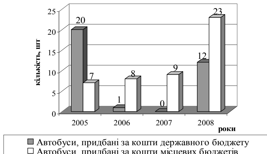
Рис. 3. Виконання програми «Шкільний автобус» у Вінницькій області, 2005-2008 рр.

В будь-якій соціально зорієнтованій державі охорона здоров'я стоїть на першому місці як запорука ефективного використання та відтворення трудового потенціалу. Протягом 2008 року у Вінницькій області створено 6 амбулаторій загальної практики-сімейної медицини (ЗПСМ) на базі ФАПів. На даний час функціонує 251 заклад та підрозділ ЗПСМ, що становить 88,2% від усіх амбулаторно-поліклінічних закладів області. Питома вага населення, яке обслуговується лікарем ЗПСМ становить 50,4%, а в сільській місцевості – 90,0%. До недоліків охорони здоров'я у сільській місцевості відносяться: недостатнє медикаментозне і матеріально-технічне забезпечення закладів; недостатні темпи оновлення парку медичного обладнання; брак сучасних медичних технологій, недостатнє володіння ними. Першочергові заходи в системі охорони здоров'я села включають: поліпшення якості медичного обслуговування дітей, вагітних і породіль; забезпечення ФАПів та сільської амбулаторії легковими автомобілями для термінової доставки хворих до районної лікарні; максимальне наближення первинної медичної допомоги до місць проживання селян.