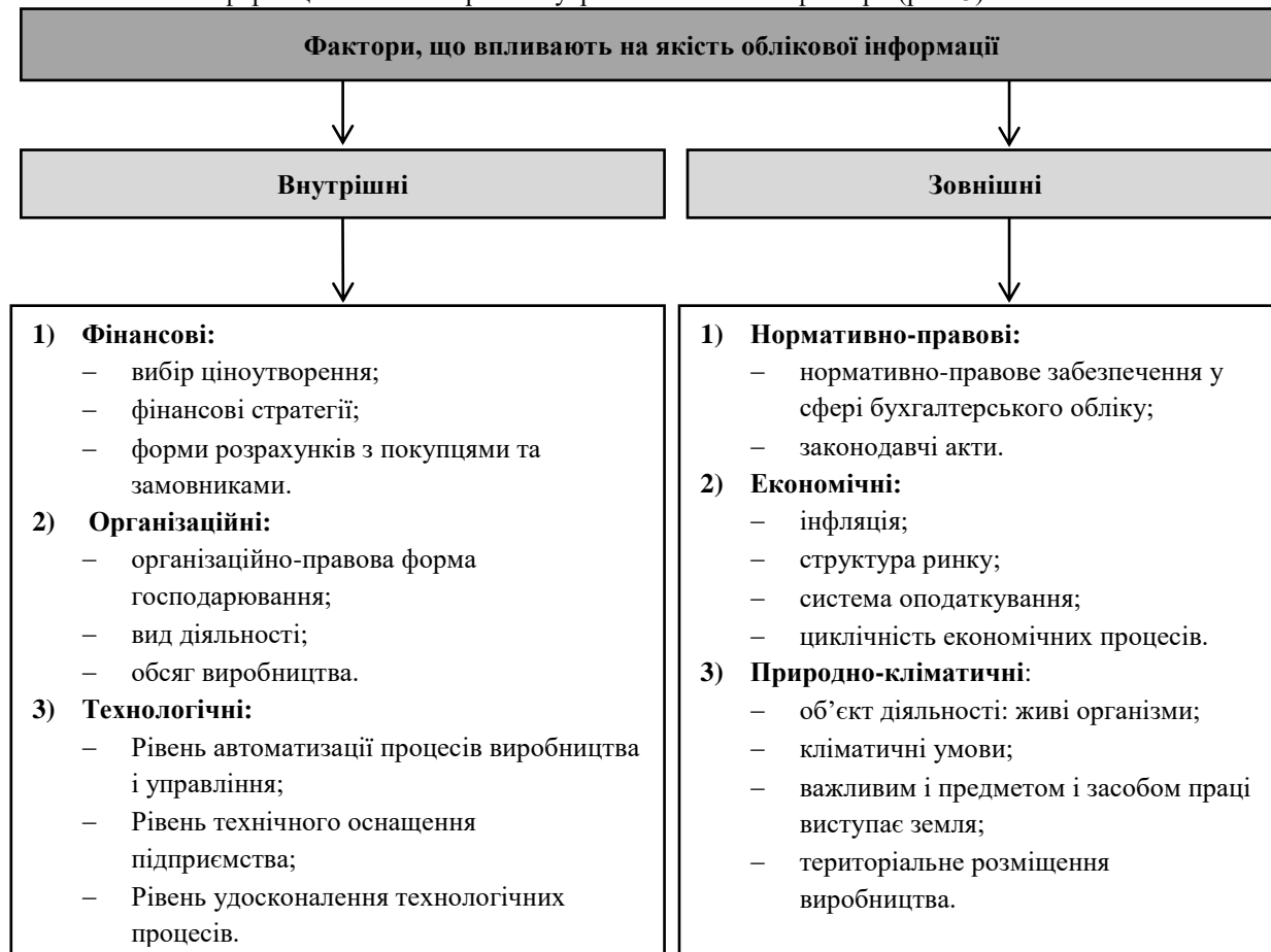
Рис.3. Фактори, що впливають на якість облікової інформації у галузі молочного скотарства

Вивчаючи особливості організації обліку у молочному скотарстві, ми повинні розуміти, що на якість облікової інформації впливають різні внутрішні та зовнішні фактори (рис. 3).