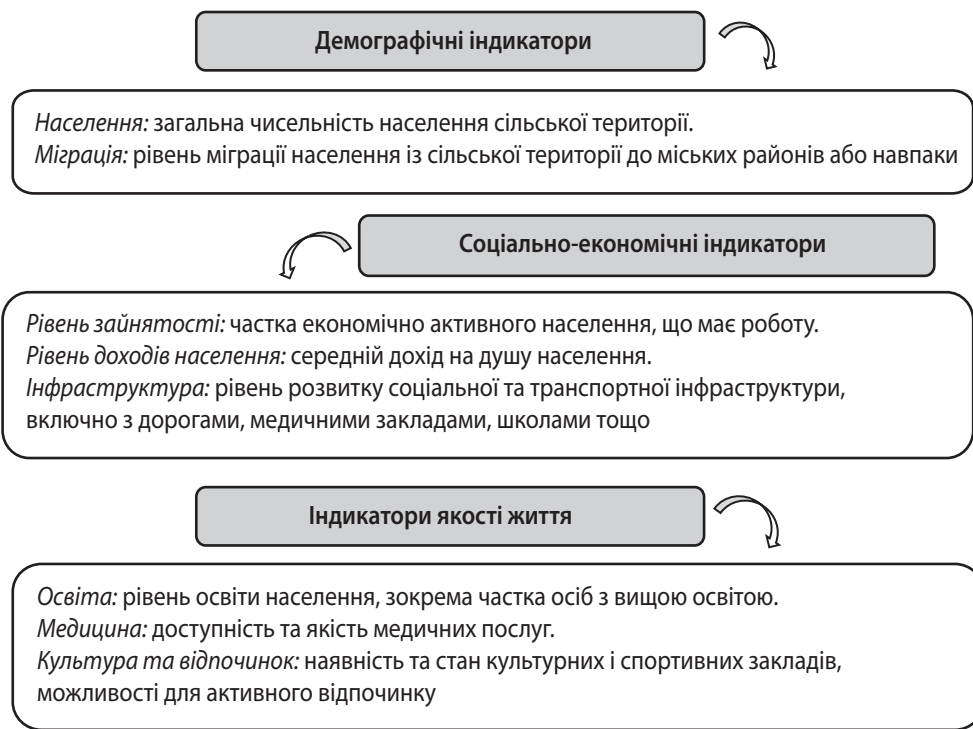
Рис. 2. Індикатори розвитку сільських територій