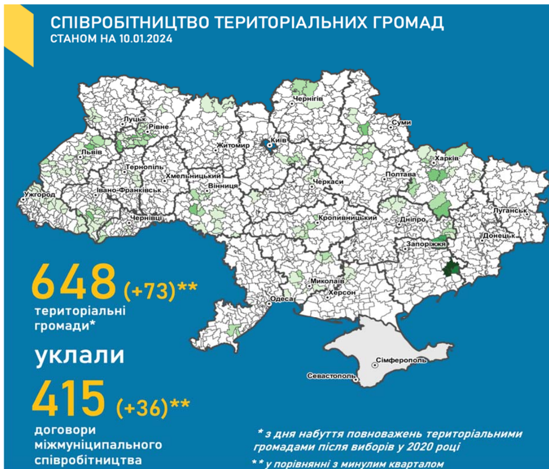
Рис. 1. Показники співробітництва територіальних громад України станом на 10.01.2024

За даними опитування, 45% територіальних громад, які мали досвід співробітництва,