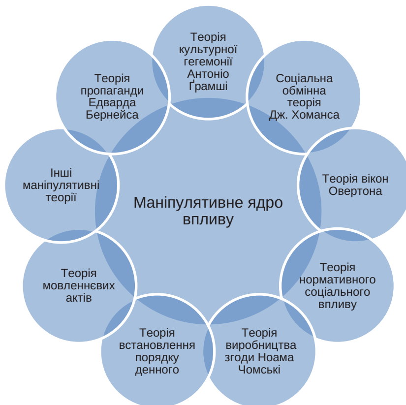
Рис. 1. Особливості формування маніпулятивного «ядра впливу»