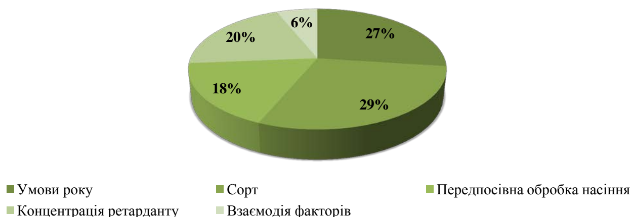
Рис. 1. Частка впливу факторів на формування врожайності за передпосівної обробки насіння бактеріальним препаратом та концентрації ретарданту

Згідно проведеного дисперсійного аналізу визначено частку впливу факторів, що були поставлені на вивчення на формування урожайності насіння сої (рис. 1).