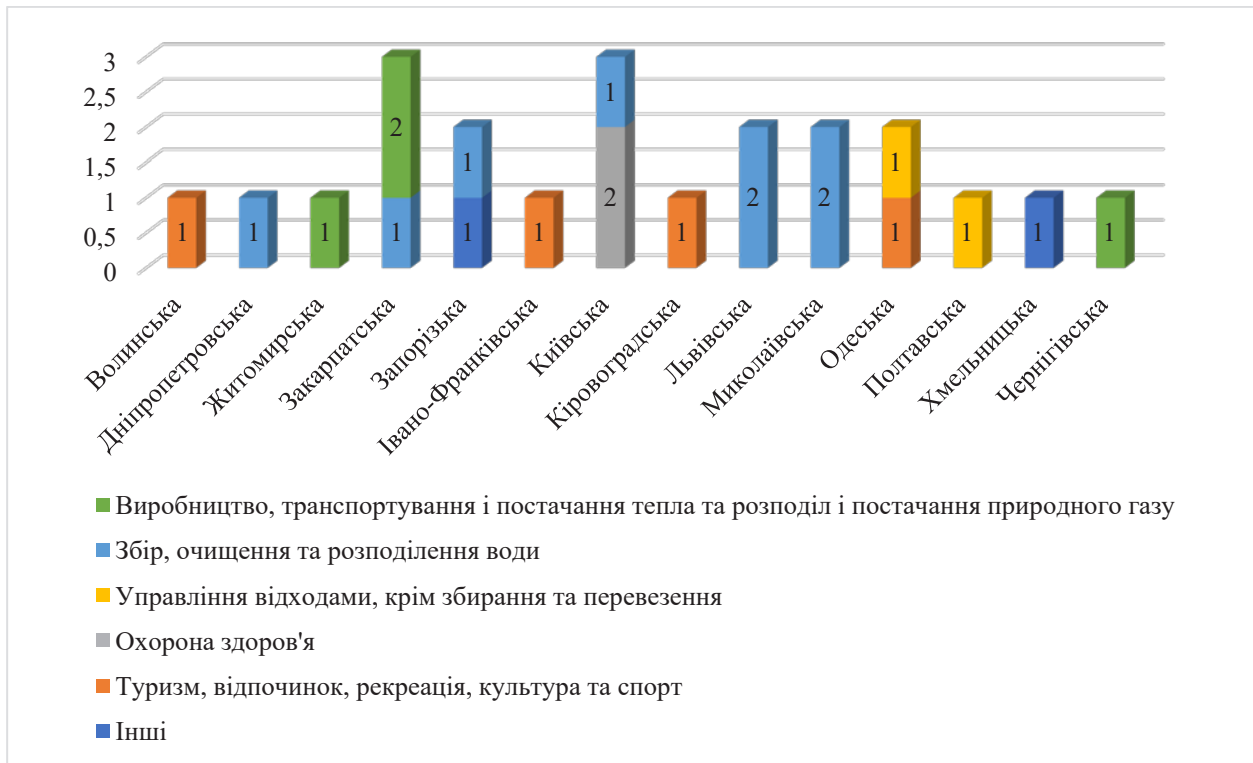
Рисунок 2 – Договори, укладені на умовах ДПП, які реалізуються станом на 01.01.2024 р.