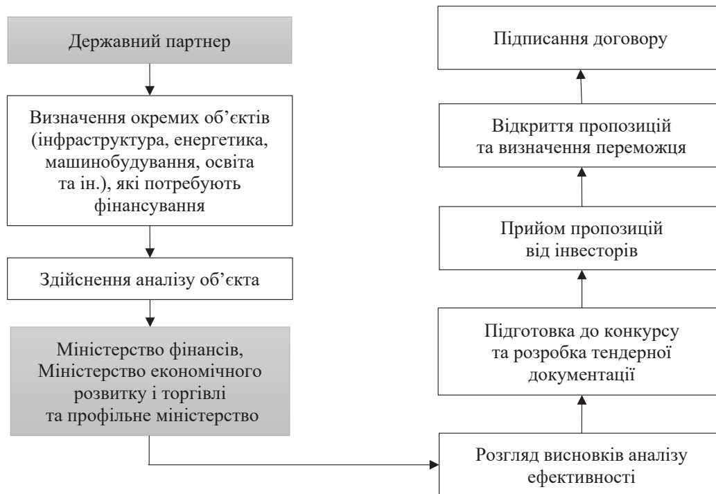
Рис. 1. Механізм реалізації проєктів у межах Закону України «Про державно-приватне партнерство»