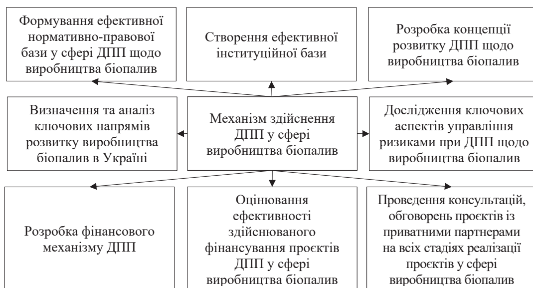
Рисунок 4 – Механізм здійснення ДПП у сфері виробництва біопалив

3) вдосконалення нормативно-правового регулювання завдяки прийняттю законодавчих актів, що стимулюють використання безвідходних технологій та розвиток виробництва біопалив;