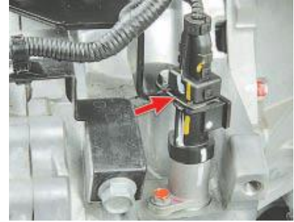
Рис. 9. Давач швидкості

Давач абсолютного тиску (рис. 8) у впускному трубопроводі перетворює розрідження в електричну напругу, за значенням якої електронний блок управління визначає навантаження двигуна. Давач встановлений на впускному трубопроводі і з'єднаний з його порожниною гумовою трубкою. Вихідна напруга давача змінюється відповідно до тиску у впускному трубопроводі – від 4,0 В (при повністю відкритій дросельній заслінці) до 0,79 В (при закритій заслінці). При непрацюючому двигуні блок керування напругою давача визначає атмосферний тиск і адаптує параметри регулювання упорскування до конкретної висоти над рівнем моря. Значення атмосферного тиску, що зберігаються в пам'яті, періодично оновлюються під час рівномірного руху автомобіля та за повного відкриття дросельної заслінки.