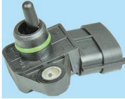
Рис. 8. Давач абсолютного тиску