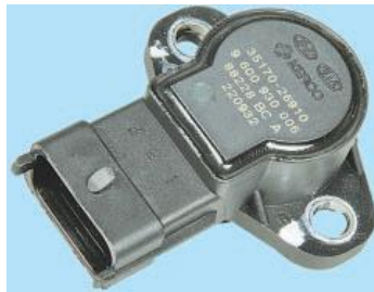
Рис. 5. Давач положення дросельної заслінки