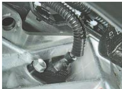
Рис. 2. Датчик положення колінчастого вала