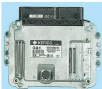
Рис. 1. Електронний блок управління

Система управління двигуном включає в себе електронний блок управління, датчі, виконавчі пристрої, роз'єми та запобіжники.