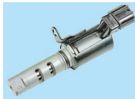
Рис. 11. Електромагнітний клапан системи зміни фаз газорозподілу

Для виведення з пам'яті електронного блоку управління кодів несправностей, виявлених під час роботи системи управління двигуном, служать діагностичні роз'єми (рис. 10). Один діагностичний роз'єм розташований праворуч у моторному відсіку, другий – у салоні автомобіля під панеллю приладів з лівої сторони. До діагностичного роз'єму можна підключити скануючий пристрій, який зчитує інформацію з послідовної лінії даних.