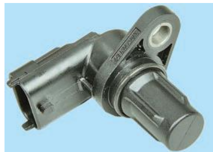
Рис. 3. Датчик положення розподільного вала

Електронний блок управління (контролер) (рис. 1) зв'язаний електричними проводами з усіма датчиками системи. Отримуючи від них інформацію, блок виконує розрахунки відповідно до параметрів та алгоритму управління, що зберігаються в пам'яті, і управляє виконавчими пристроями системи.