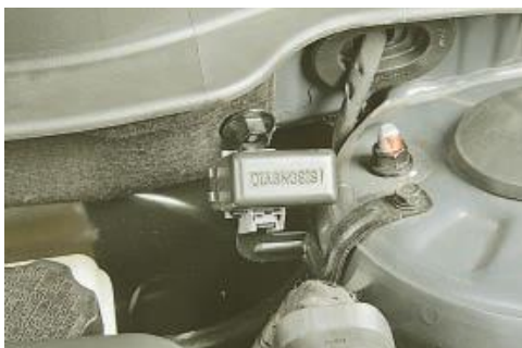
Рис. 10. Діагностичний роз'єм

Давач швидкості (рис. 9) автомобіля встановлений на коробці передач. Принцип дії давача ґрунтується на ефекті Холла. Давач видає на електронний блок управління прямокутні імпульси напруги, частота яких пропорційна швидкості обертання ведучих коліс.