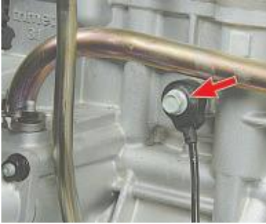
Рис. 7. Давач детонації

Давач детонації (рис. 7) прикріплений до верхньої частини блоку циліндрів у зоні між другим та третім циліндрами та вловлює аномальні вібрації (детонаційні удари) у двигуні. Чутливим елементом давача детонації є п'єзокристалічна пластина. При детонації на виході давача генеруються імпульси напруги, які збільшуються зі зростанням інтенсивності детонаційних ударів. Електронний блок за сигналом давача регулює випередження запалення для усунення спалахів палива.