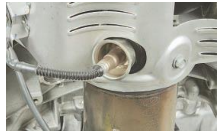
Рис. 6. Давач концентрації кисню

Давач положення дросельної заслінки (рис. 5) встановлений на корпусі дросельного вузла та зв'язаний з віссю дросельної заслінки. Давач являє собою потенціометр, на один кінець якого подається «плюс» напруги живлення (5 В), а інший кінець з'єднаний з "масою". З третього виводу потенціометра (від повзунка) йде вихідний сигнал до електронного блоку управління.