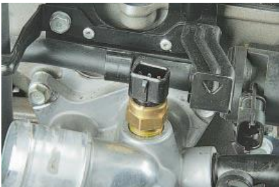
Рис. 4. Давач температури охолоджуючої рідини

У корпусі давача встановлений також додатковий термістор для керування покажчиком температури охолоджуючої рідини у комбінації приладів.