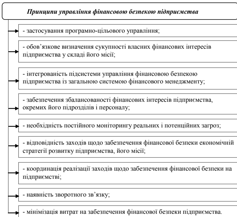
Рис. 1. Принципи управління фінансовою безпекою підприємства

Тобто, розглядаючи фінансову безпеку підприємства, вчені акцентують увагу на фінан-