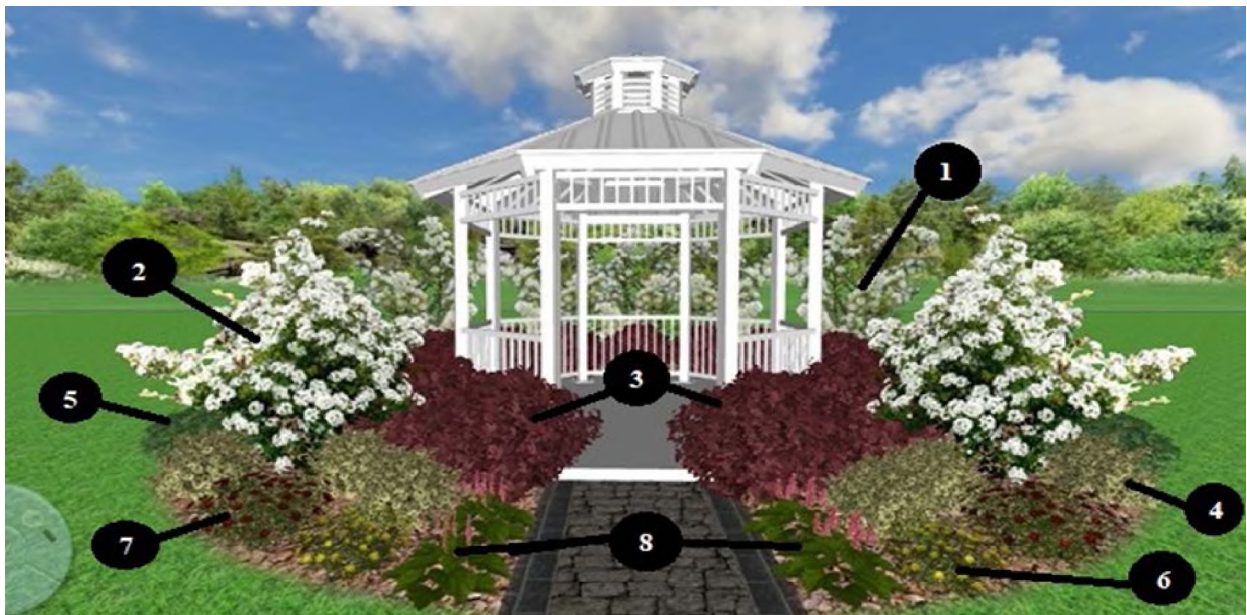
Рис. 1. Проект озеленення малих архітектурних форм у садово-паркових композиціях