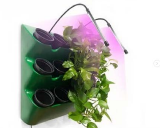
Рис. 3. Схематичне зображення проектування системи освітлення «зелених конструкцій» в умовах інтер'єру закритого середовища

складається з двох фітоламп з блоком управління розташованим на верхній панелі модуля. Живлення від мережі 220 В (рис. 3).