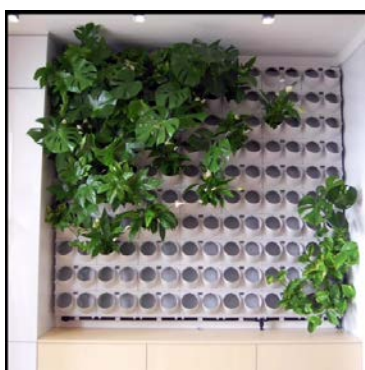
II етап Зелені акцентні