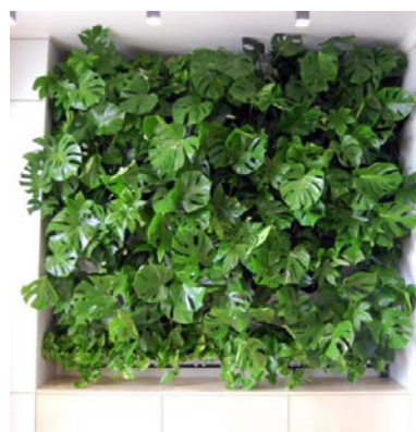
III етап Квітучі акцентні