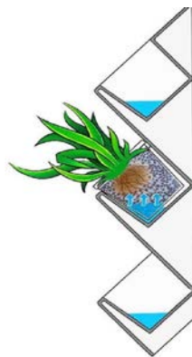
Рис. 2. Схематичне зображення проектування «зелених конструкцій» в умовах інтер'єру закритого середовища

Система вертикального озеленення складалась із блоків, спеціальних кріплень блоків до основної поверхні стіни, облицювальних торців, насоса, станції поливу, трубки і крапельниць, водоприймального лотка і садивного матеріалу (рис.2).