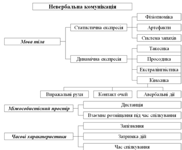
Рис. 1. Компоненти невербальної комунікації

сходитись і розходитись під час висловлювань – використання риторичних жестів. Значення основних жестів подано в таблиці 1.