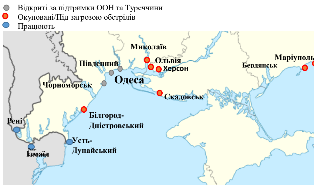
Рис. 2. Мапа функціональності українських портів, станом на серпень 2022 р.

За даними, наведеними українськими експертами, видно, що логістичні проблеми з вивезення продукції за кордон є досить суттєвими. На рис. 2 подана мапа функціональності українських портів станом на серпень 2022 р., де 7 із 13 портів окуповані, або під загрозою обстрілів, 3 відкриті за підтримки ООН та Туреччини і лише 3 працюють [6].