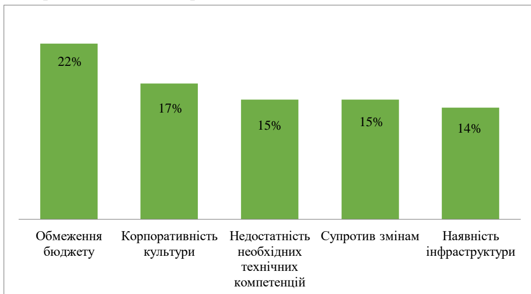
Рис. 1. Бар'єри діджиталізації в секторі логістики та управління ланцюгами поставок згідно опитування GT Nexus (2016) (% опитаних)

Разом із тим згідно з дослідженням існує парадокс у тому, що самі компанії, їх «застарілий» стиль управління є істотним бар'єром на шляху цифрових перетворень – їх бізнес-моделей, бізнес-процесів та інструментів корпоративного управління. Цю думку підтверджує проведене у 2018 р. опитування (кількість опитаних – 337 відповідальних осіб серед найбільших у світі виробничих та торговельних компаній (здебільшого країни Європи та Північної Америки) [18, с. 114] (рис. 1).