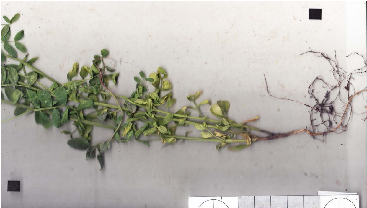
Рисунок 3. Ознаки ушкодження (пожовтіння) листостеблової маси рослин сочевиці сорту Лінза за умов зволоження 2019 року (помітно інтенсивне пожовтіння нижньої частини стебла з асиміляційним апаратом та викривленість стебла за початку стеблогого її вилягання) (розмірність чорного квадрата 2x2 см).