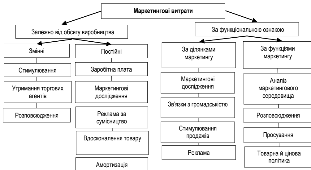
Рис. 1. Класифікація маркетингових витрат підприємства*

Ющак Ж. М. вважає, що доцільно розглядати маркетингові витрати за ділянками та за функціями маркетингу, що відображено на рис. 1 [15].