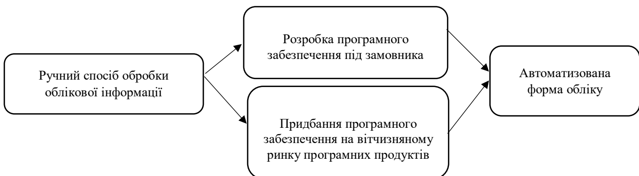
Рис. 2. Способи переходу на автоматизовану форму обліку

Для переходу на автоматизовану форму обліку в таких господарствах є два надійних способи (рис. 2).