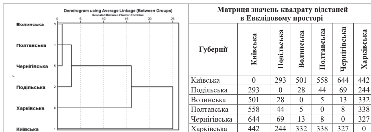
Рис. 4. Результати кластерної класифікації губерній за даними табл. 5; 6