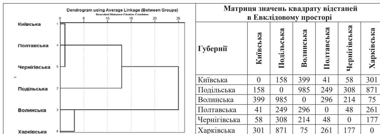
Рис. 3. Результати кластерної класифікації губерній за даними табл. 3; 4