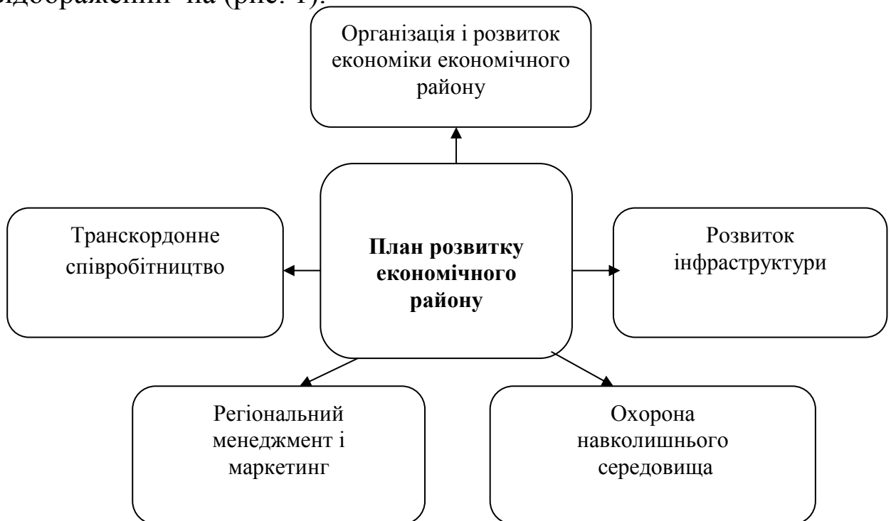
Рис. 1. План розвитку економічного району

Пропонований план розвитку містить п'ять найважливіших розділів: організація і розвиток економіки економічного району; розвиток інфраструктури; охорона навколишнього середовища; розвиток людських ресурсів і матеріальних зв'язків; регіональний менеджмент і маркетинг, транскордонне співробітництво відображений на (рис. 1).