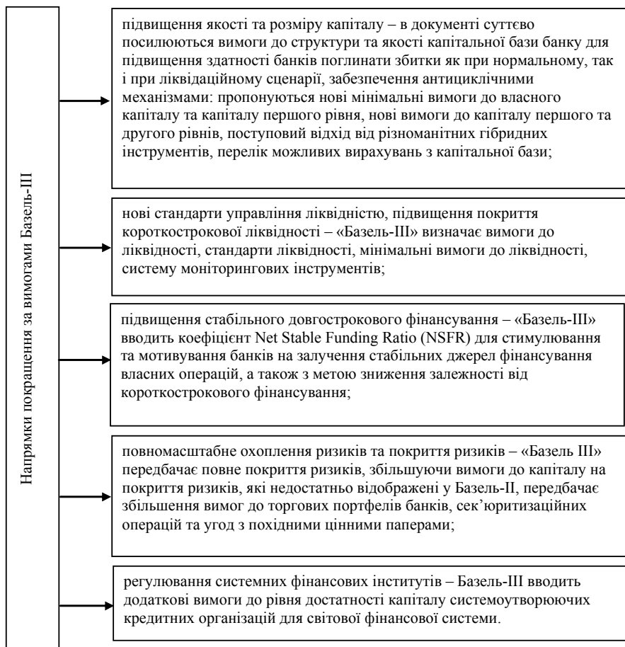
Рис. 2. Напрямки покращення за вимогами Базель-III

У вересні 2010 р. Базельський комітет з банківського нагляду прийняв так званий стандарт Базель-III, що був розроблений як відповідь на виклики глобальної фінансової кризи та призначений підвищити стійкість банківських систем. Базель-III не скасовує попередні угоди по капіталу (у межах Базеля-I і Базеля-II), а доповнює їх і спрямований на усунення визнаних міжнародним співтовариством недоліків існуючих стандартів регулювання, таких як недостатній рівень вимог до капіталу банку, можливість включати в капітал гібридні інструменти без обов'язкової їх конвертації або списання на збитки, про циклічність регулювання, не-