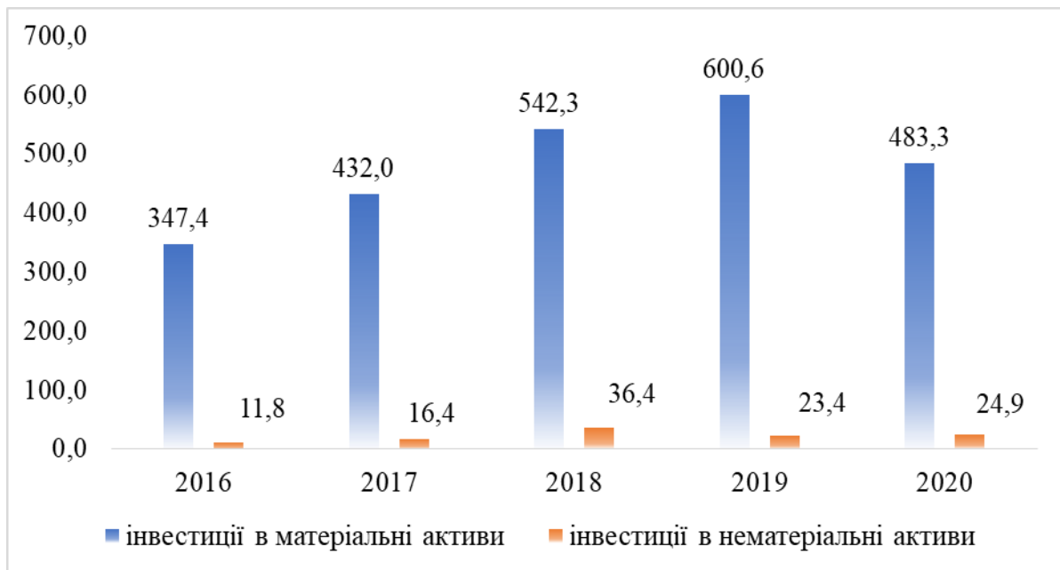
Рис. 3. Динаміка капітальні інвестиції в Україні за матеріальних та нематеріальних активів за 2016-2020 роки, млрд грн