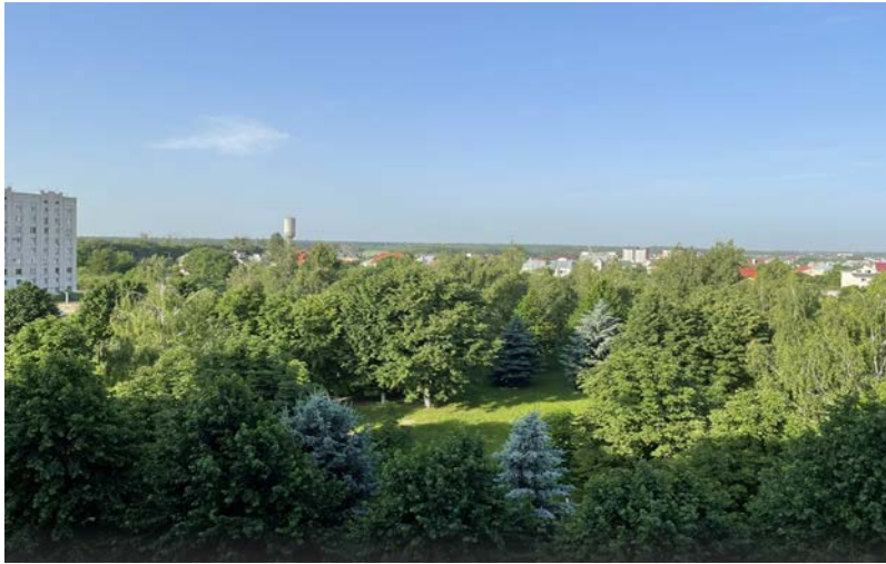
Рис. 3. Розарій, що рекомендується для створення в умовах паркової зони Вінницького національного аграрного університету

Джерело сформовано на основі власних результатів досліджень