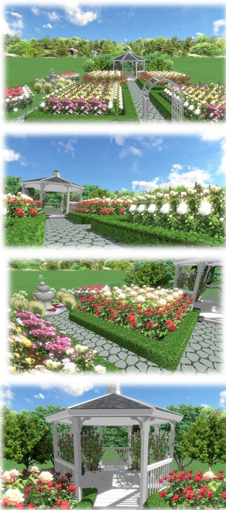
Рис. 2. Рекомендований варіант створення розарію в умовах паркової зони Вінницького національного аграрного університету