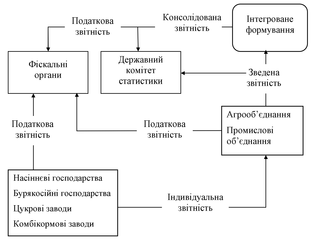
Рис. 2 Рух бухгалтерської звітності в інтегрованому підприємстві

Це визначає особливість організації звітності, починаючи від сільськогосподарських підприємств і закінчуючи формуванням показників про діяльність всього інтегрованого формування.