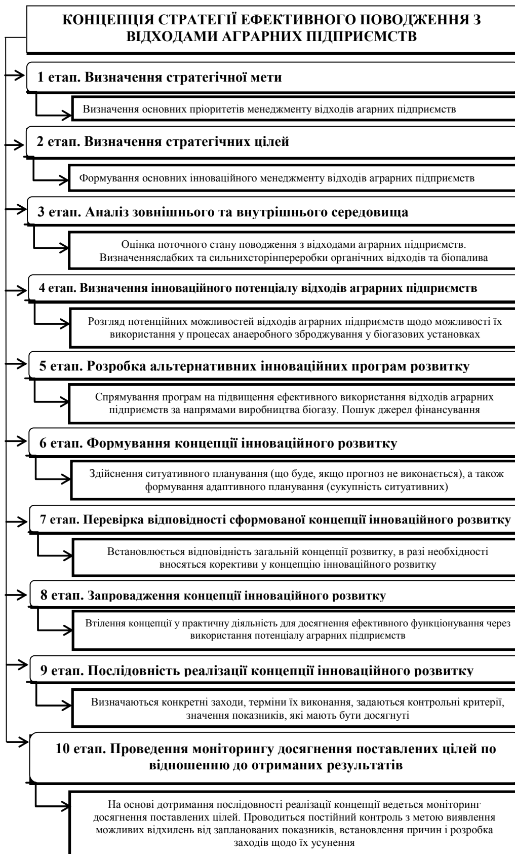
Рис. 3. Механізм етапів реалізації Стратегії ефективного поводження з відходами аграрних підприємств