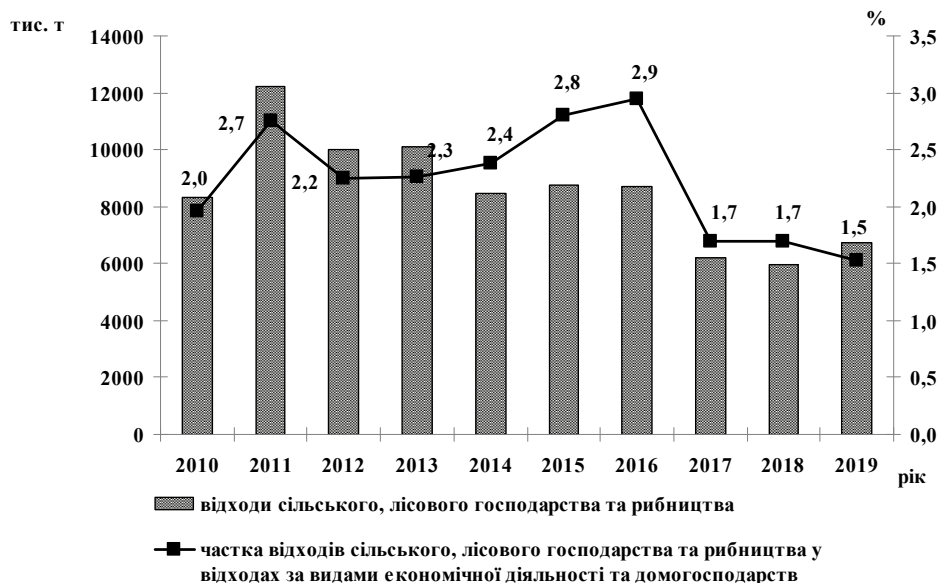
Рис. 1. Утворення відходів сільського, лісового та рибного господарства та їх частка у відходах за видами економічної діяльності та домогосподарств в Україні, 2010–2019 рр., тис. т / %

В агропромисловому секторі на підприємствах з виробництва та переробки продукції галузі рослинництва утворюється близько 80 млн т відходів щорічно. Після збору врожаю в підприємствах утворюються понад 60 млн т первинних відходів, одержуваних у результаті вирощування сировини і збору врожаю, і 20 млн т — вторинних відходів, одержуваних у результаті технологіч-