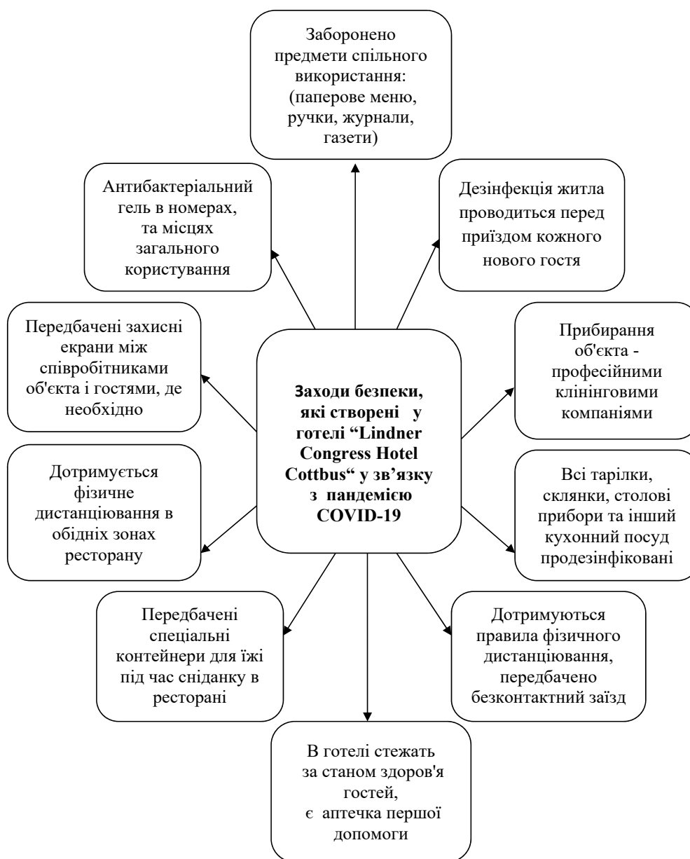
Рис. 1. Заходи безпеки, які створені у готелі Lindner Congress Hotel Cottbus у зв'язку з пандемією COVID-19

Розглянемо діяльність 4-зіркового готелю, який розташований в історичному центральному кварталі міста Котбус. Зручні та просторі номери готелю Lindner Congress Hotel Cottbus оснащені всіма сучасними засо-