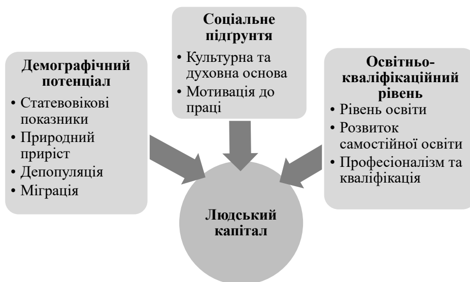
Рис. 3. Фрагментація структури людського капіталу села

Задля підвищення якості людського капіталу та вдосконалення формування трудового потенціалу необхідно здійснювати реформування ринку праці за такими напрямками, як удосконалення системи оплати праці; соціальна підтримка окремих груп населення; стимулювання державою розвитку малого та середнього бізнесу; вдосконалення нормативно-правового регулювання; зменшення податкового навантаження на підприємства; розроблення активної державної соціально-економічної політики, спрямованої на залучення молоді та випускників вищих навчальних закладів [1, с. 9].