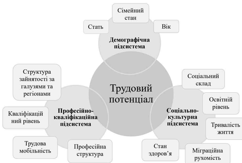
Рис. 1. Чинники, які впливають на трудовий потенціал