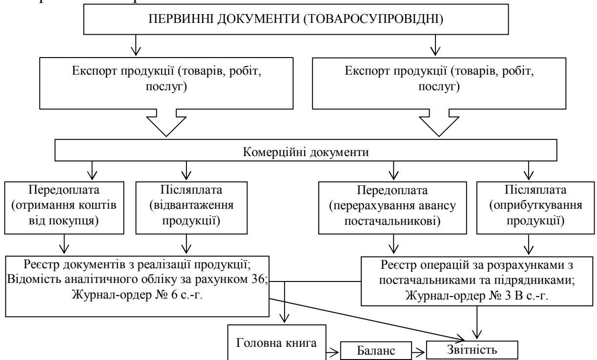
Рис. 2. Алгоритм формування інформації аналітичного і синтетичного обліку експортно-імпортних операцій

Для формування облікової політики зовнішньоекономічних операцій важливе значення має процес організації обліку такої діяльності. Схематично він зображений на рис. 2.