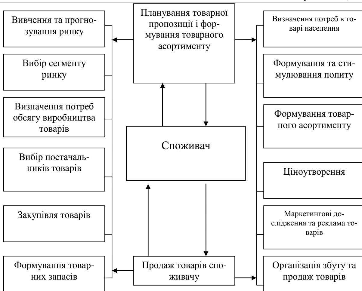
Рис. 1. Схема впливу споживачів на формування ринку роздрібної торгівлі

На основі аналізу джерел [1, 2, 3, 5, 14] конкуренція в роздрібній торгівлі може бути класифікована за такими критеріями: