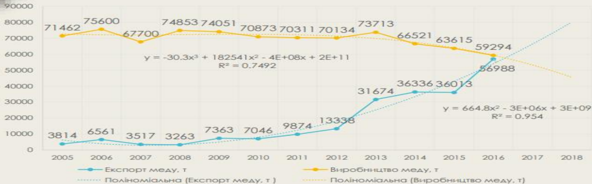
Динаміка виробництва та експорту меду в Україні, тон