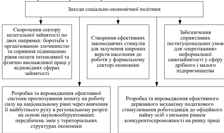
Рисунок 3 – Заходи соціально-економічної політики для скорочення рівня тіньової зайнятості

Заходи соціально-економічної політики для скорочення рівня тіньової зайнятості в Україні відобразимо на рис 3.