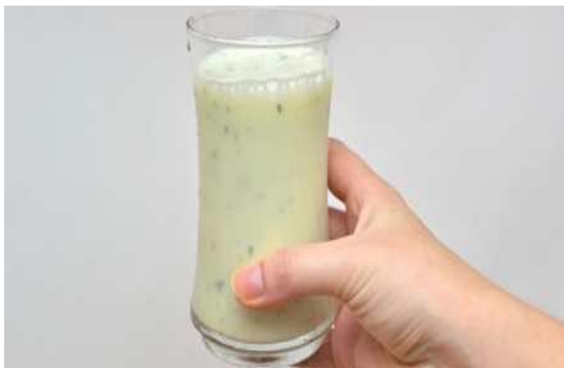
Fig. 3. Sour-milk drink from skolotyn enriched with prebiotics «Pytnyi Mix»

Figure 3 presents a prepared sour-milk drink from skolotyn enriched with prebiotics «Pytnyi Mix».