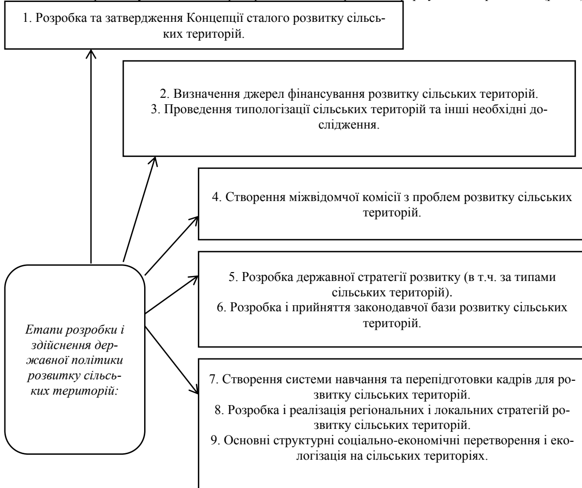
Рис. 2. Основні етапи розробки і здійснення державної політики розвитку сільських територій Джерело: сформовано за результатами дослідження

На жаль, наразі не існує ефективної державної політики щодо розвитку сільських територій в Україні. Певна серія етапів повинна бути реалізована в рамках її формування та реалізації (рис. 2).