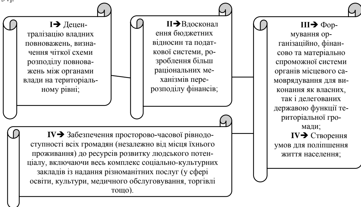
Рис. 3. Головні складові реформування системи адміністративно-територіального устрою управління розвитком сільських територій

У зарубіжній та вітчизняній практиці управління стійким розвитком сільських територій немає готових рецептів вирішення всіх виникаючих проблем, і кадри повинні бути готові до інновацій у своїй роботі. Роботу з кадрами сільських територій різного рівня слід здійснювати за такими напрямками: виходячи зі стратегії розвитку, необхідно здійснювати раціональне заміщення посад [1]. Крім того, з метою забезпечення сталого розвитку сільських територій, актуальним є реформування системи адміністративно-територіального устрою, що передбачає вирішення ряду питань (рис. 3).