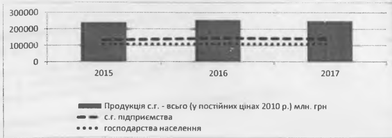
Рис. 1. Виробництво валової продукції с.г., млн грн

Негативна ситуація у діяльності сільськогосподарських підприємств змусила господарства населення збільшувати обсяги виробництва сільськогосподарської продукції, як для власного споживання, так і на реалізацію з метою отримання додаткових прибутків. Це призвело до зростання виробництва валової продукції господарствами населення майже до рівня сільськогосподарських підприємств. Традиційно більшість української агропродукції – товари рослинництва (рис. 2).