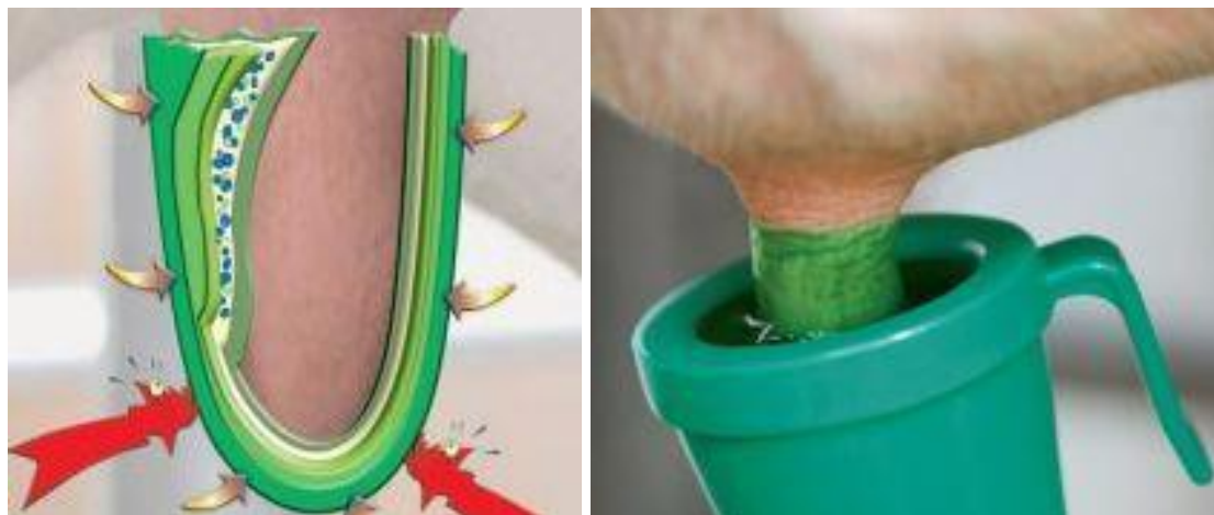
Рис. 1. Консервація вимені

5. Постдипінг (консервація) – дезінфекція дійок після доїння – забезпечує закриття дійкового каналу від проникнення бактерій (рис. 1). Доведено, що канал залишається відкритим 30-60 хв. після доїння [3].