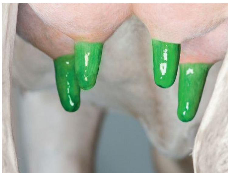
Рис. 5. Консервація вимені Senso Dip 50

Прогнозовано, що порівняно з рівнем захворювання на мастит у господарстві, який попередньо становив 17%, відбудеться зниження його виникнення у дійному стаді на 35-45%.