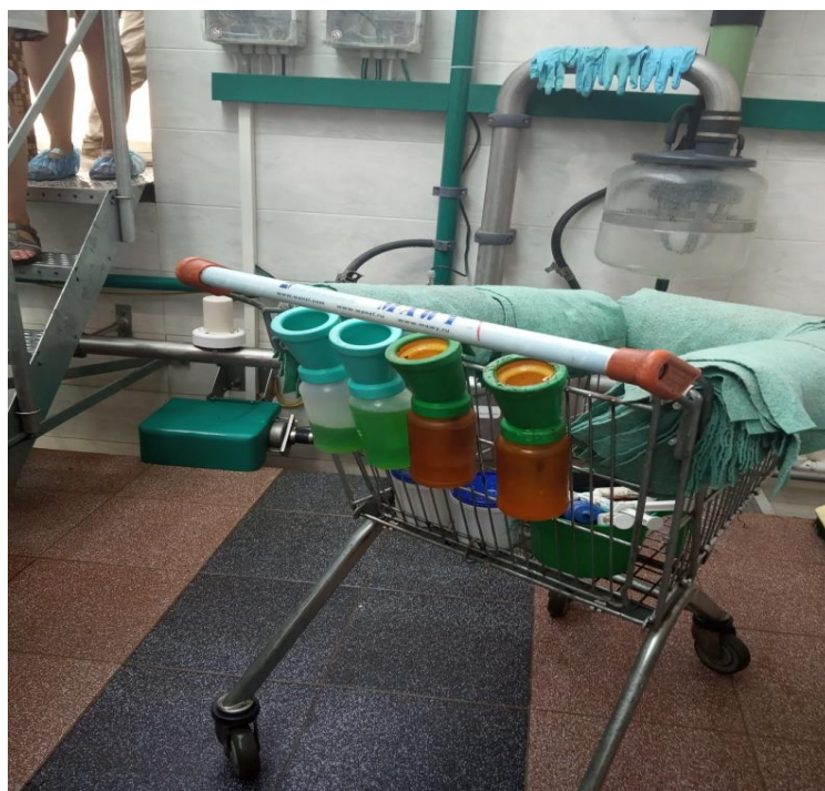
Рис. 4. Стакани та багаторазові серветки для обробки сосків вимені до і після доїння