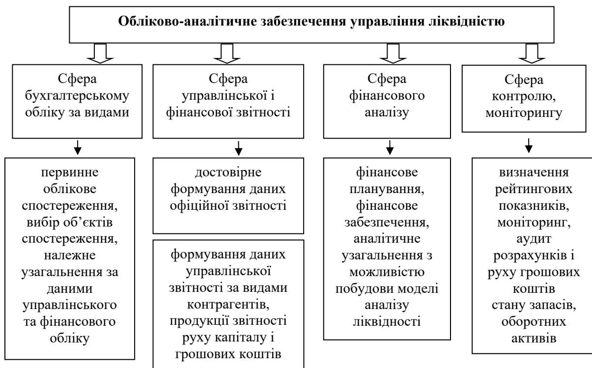
Рис. 3. Вимоги до системи обліково-аналітичного забезпечення управління ліквідністю

управлінського та фінансового обліку. До сфери звітності відносяться: достовірне формування даних звітності, можливо з частішою періодичністю, ніж офіційна звітність. Для сфери аналізу: професійне фінансове планування, достатнє фінансове забезпечення, аналітичне узагальнення з можливістю побудови моделі аналізу ліквідності аграрних підприємств, формування оптимального балансу власних та позичених коштів з метою підвищення рівня ліквідності.