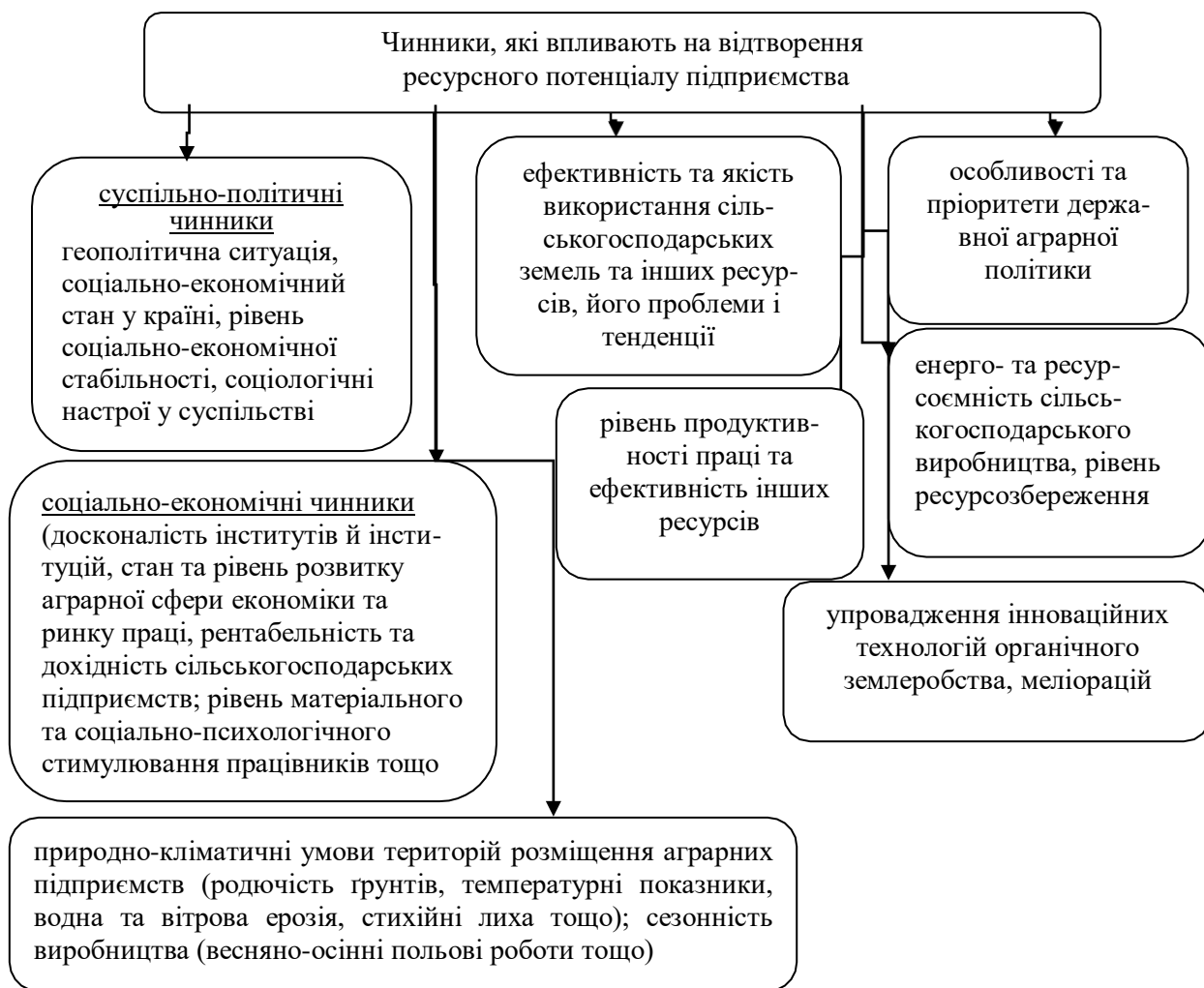
Рис. 2. Чинники, які впливають на відтворення ресурсного потенціалу сільськогосподарських підприємств

Велике значення має визначення чинників [4, с. 56-85], які впливають на відтворення ресурсного потенціалу сільськогосподарських підприємств як фактора сільськогосподарського виробництва (рис. 2).