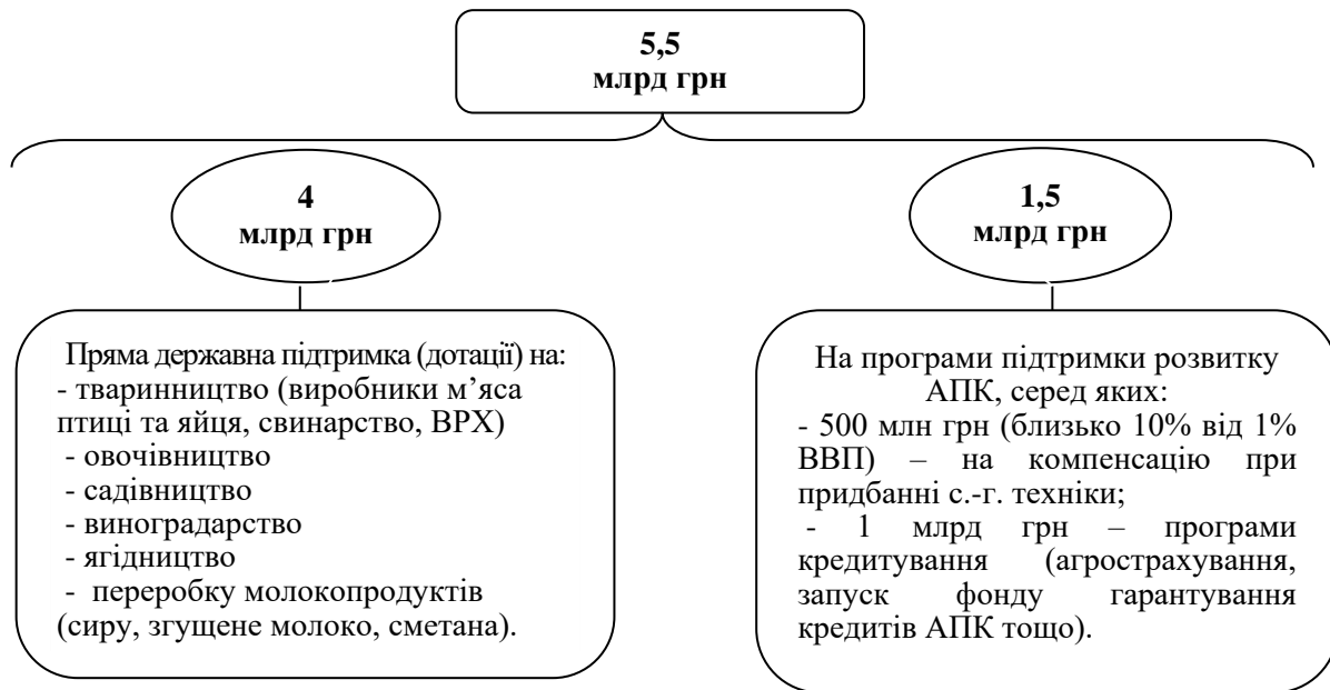
Рис.2. Державна підтримка АПК