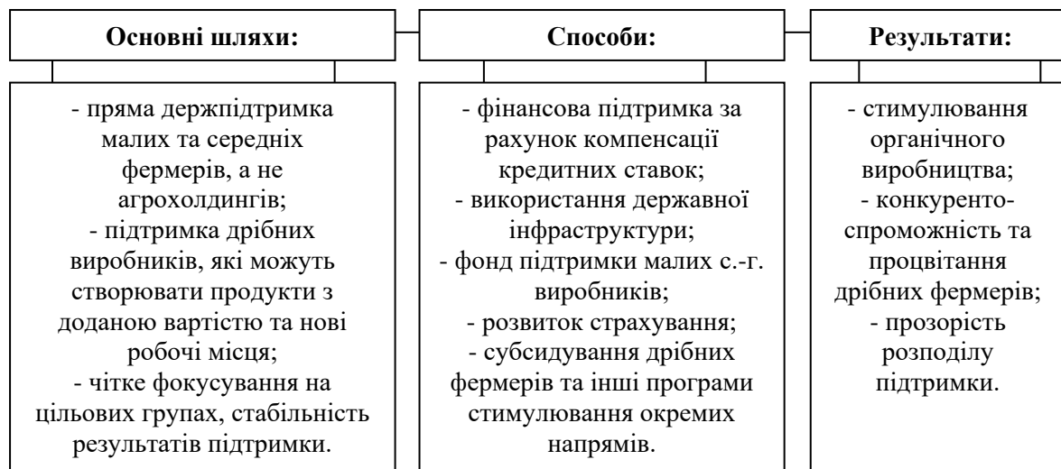
Рис. 3. Шляхи вирішення проблем державної підтримки АПК

Проведений аналіз динаміки змін показників фінансової підтримки АПК України (Міністерство аграрної політики та продовольства) підтверджує те, що фінансова підтримка АПК у 2017 році в порівнянні з 2012 роком зменшилась на 3,1 млрд грн, проте в порівнянні з двома останніми роками (2015-2016 рр.) прослідковувалась тенденція до збільшення. Показник 2017 року в порівнянні із 2015 роком збільшився на 3,8 млрд грн, із 2016 р. – на 3,9 млрд грн.