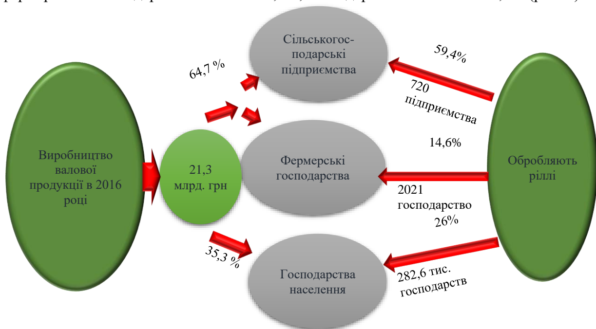
Рис. 1. Структура виробництва валової продукції сільського господарства у Вінницькій області.

Валова продукція, одержана від сільськогосподарських підприємств та фермерських господарств становить 64,7%, господарств населення – 35,3% (рис. 1).