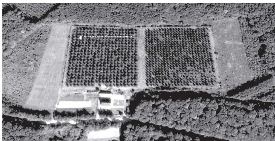
Рис. 2. Просторовий аналіз інтенсивності насінношення (утворення 2-річних шишок) сосни звичайної фінського походження станом на жовтень 2017 р.