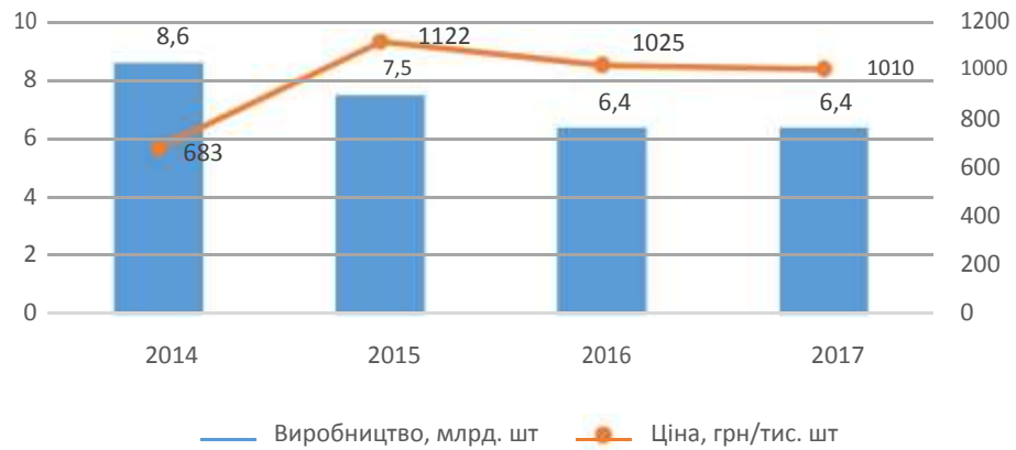
Рис. 1. Виробництво та ціна реалізації яєць сільськогосподарськими підприємствами (січень-травень 2014-2017 рр.), млрд. шт.

Отже, скорочення виробництва яєць відбулось через зниження прибутковості галузі. Неможливим стало підвищення цін через зменшення купівельної спроможності населення, але водночас зросли витрати підприємств (збільшення вартості енергоресурсів, комунальних послуг, заробітної плати тощо). Протягом 2015 року прослідковувалась тенденція одночасного підвищення витрат підприємств та цін, протягом даного року витрати у тваринництві зросли на 63,3% (у порівнянні з 2014 р.), а ціни на то яйця на 64%. В результаті впливу негативних факторів на товаровиробників, протягом 2015 року порівняно з 2014 роком виробництво яєць скоротилося на 14,3% до 16,78 млрд. шт.