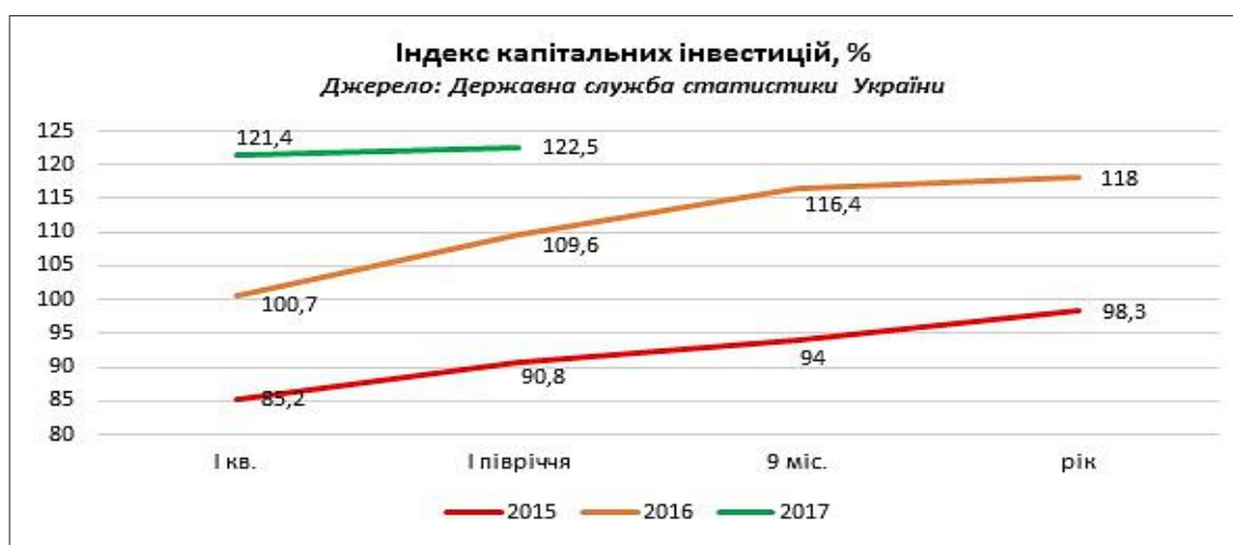
Рис. 1. Індекс капітальних інвестицій

У січні-червні 2017 р. підприємствами та організаціями освоєно 155,1 млрд. доларів. Головним джерелом інвестування є власні кошти підприємств, частка яких становить 74,3% загального обсягу капітальних інвестицій [5].