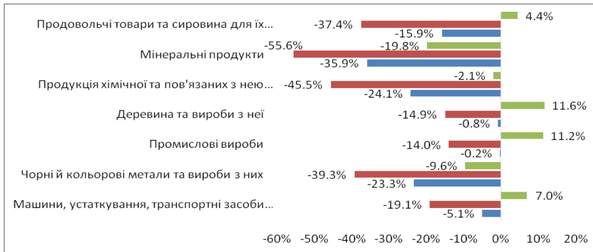
Рис. 3. Динаміка експорту до ЄС за товарними групами протягом 2015–2017 рр.