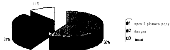
Рис.3. Структура суми матеріального стимулювання ТОВ "УСТЯ" в середньому за 2014-2016 рр.

Господарство постійно збільшує обсяги матеріально стимулювання. Так за досліджуваний період його сума зросла на 336 тис грн, або на 32 % (табл.1). Також збільшується й питома вага обсягів матеріального стимулювання в загальній сумі фонду оплати праці - з 31,1% у 2014 р. до 36,3% у 2016р. (рис.2).