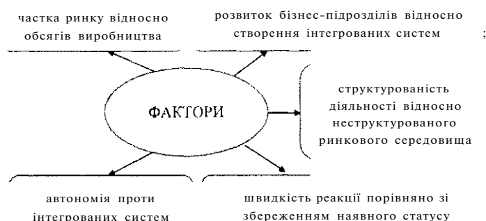
Рис. 1. Фактори, які визначають зміни в конкретних позиціях підприємства та перспективах його розвитку