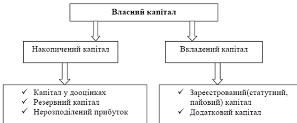
Рис. 1. Класифікація власного капіталу підприємства

Класифікацію власного капіталу представимо на рис. 1.