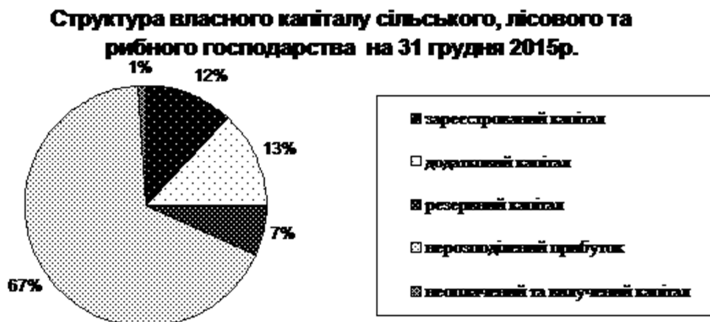
Рис. 5. Структура власного капіталу сільського, лісового і рибного господарства України на 31 грудня 2015 р.

На кінець року структура власного капіталу сільського, лісового і рибного господарства має такий вигляд (рис. 5).