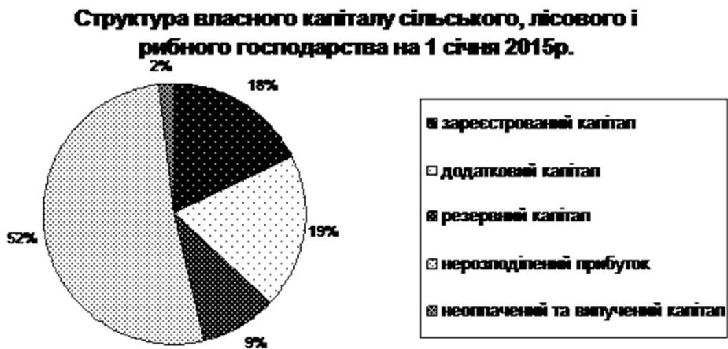
Рис. 4. Структура власного капіталу сільського, лісового і рибного господарства України на 1 січня 2015 р.

Розглянемо структуру власного капіталу у сільському, лісовому та рибному господарстві на рис. 4.