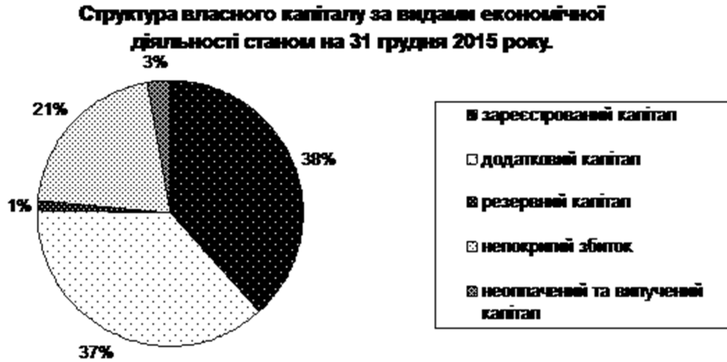
Рис. 3. Структура власного капіталу за видами економічної діяльності в Україні станом на 31 грудня 2015 р.

Розглянемо, як змінилася ситуація в структурі власного капіталу на кінець 2015 року (рис. 3).