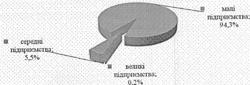
Рис. 2. Кількість підприємств за їх розмірами у відсотках до загальної кількості підприємств станом у 1.01.2017 році [7].

За даними Державного комітету статистики України у 2016 році основним джерелом інвестування для всіх суб'єктів господарювання залишалися власні кошти, що складало 59,2 % від загального обсягу фінансування в середньому по Україні, кредити й інші зовнішні позики – 16,1 %, кошти з держбюджету і місцевих бюджетів – 6,3 % і 3,2 % відповідно.