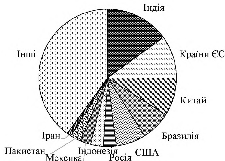
Рис. 2. Топ-10 світових споживачів цукру [2]

Споживання цукру в світі збільшується, в основному, за рахунок країн Азії та Африки. Найбільшими споживачами у світі є Індія (20-25 %), країни ЄС (15-18 %) та Китай (10-15 %). Також значну частку споживають Бразилія, США, Індонезія, Росія (рис. 2). Серед країн СНД безперечним лідером споживання цукру є Росія (біля 60 %), Україна займає друге місце (приблизно 20 %), далі йдуть Узбекистан (7 %), Казахстан (5 %) та Білорусь (4 %).