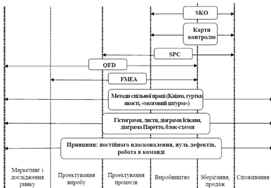
Рис. 2. Етапи застосування сучасних принципів, методів та інструментів адаптованих до сільськогосподарського виробництва