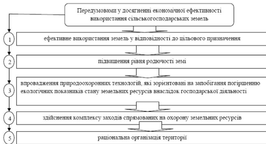
Рис. 1. Передумовами у досягненні економічної ефективності використання сільськогосподарських земель

Проте, щоб здійснити таку оцінку, потрібні і знання, досвід і можливість якісно оцінити ефективність використання ресурсів, чого часто бракує. Це можуть забезпечити лише сертифіковані внутрішні аудитори, чи аудиторські фірми. Важливі передумовами у досягненні економічної ефективності використання сільськогосподарських земель нами виокремлено та представлено на рисунку 1.